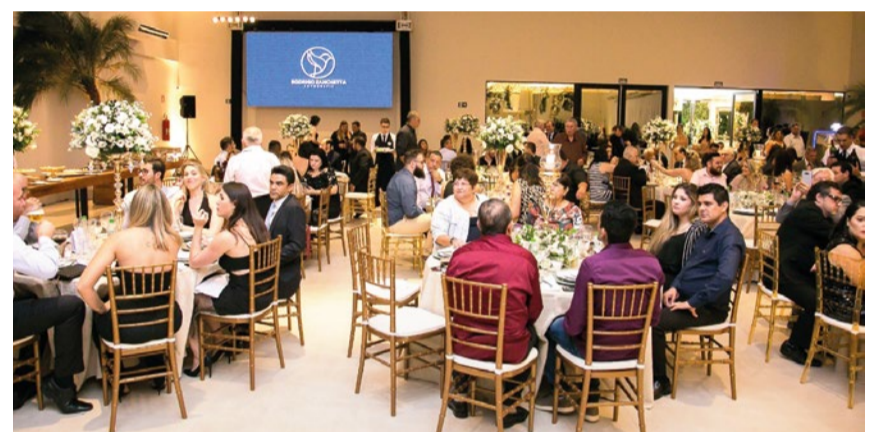
Festa deve reunir cerca de 300 convidados