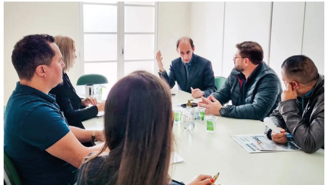
Encontro com o secretário de Desenvolvimento, Sebrae e Banco do Povo

O presidente da ACIAS destacou que são assuntos importantes e precisam ser tratados com urgência. “A troca da iluminação das regiões de comércio da cidade se trata de questão urgente, em preparação para abertura em horário noturno para as vendas de Natal, sendo ainda imprescindível da revisão dos prazos de licenciamento das