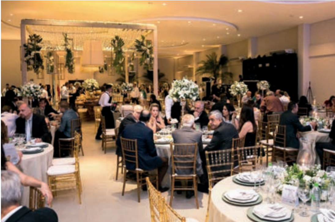
Evento é um dos mais aguardados na cidade

Sumaré está em contagem regressiva para o Jantar do Empresário. Depois de dois anos, o evento mais aguardado do calendário business está de volta e já tem data marcada. O jantar será realizado no dia 22 de outubro, no San Ville Hall. A expectativa é reunir cerca de 300 pessoas, entre empresários, comerciantes, prestadores de serviços, autoridades, diretores da Acias e convidados.