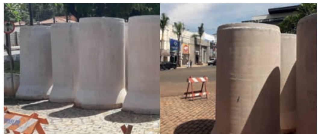
Tubulação que será utilizada nas obras para conter os transtornos causados em dias de chuva

De acordo com as informações da prefeitura, apenas a implantação das galerias de águas pluviais, no início da Avenida 7 de Setembro, deverá ser realizada nesse ano. Mas a prefeitura ainda não informou quando essas obras serão iniciadas. A tubulação que será utilizada nas obras já está no final da Avenida 7 de Setembro, próximo da Estação Ferroviária.