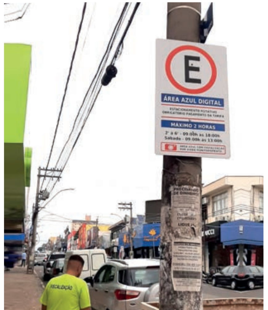
Zona Azul: aperfeiçoamento do serviço é uma cobrança constante da ACIAS

A Acias também é um ponto de venda dos tíquetes.