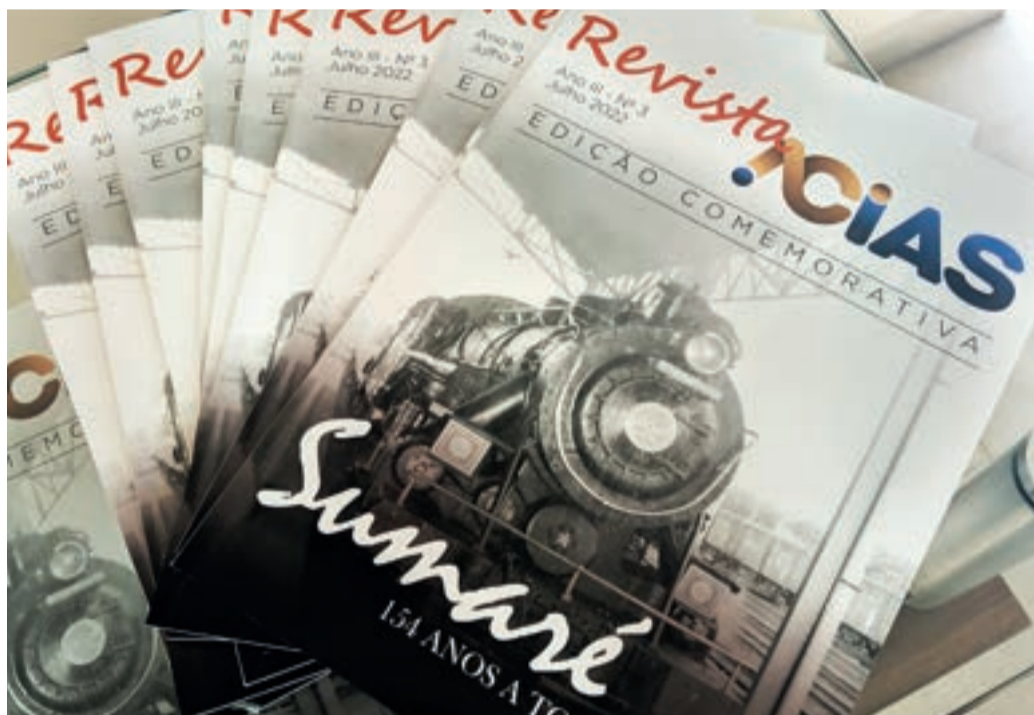
Revista traz histórias inspiradoras de quem vive a cidade

Além da distribuição a associados e patrocinadores, a revista está disponível em locais estratégicos e de ampla circulação na cidade.