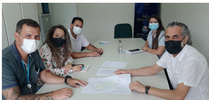
Reunião entre a BRK e a ACIAS

Para diminuir os transtornos na região central de Sumaré no período das compras de Natal, as obras de substituição de redes realizadas pela concessionária BRK, responsável pelos serviços de água e esgoto de Sumaré, serão suspensas temporariamente no mês de dezembro. O trabalho envolvendo os funcionários, as máquinas e os caminhões será retomado apenas a partir de 3 de janeiro de 2022. A decisão foi tomada a pedido da ACIAS.