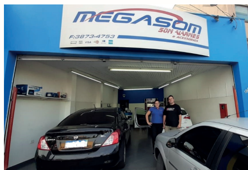
Empresa tem linha completa de acessórios para o seu carro

A MegaSom Multimídia e Acessórios está fazendo 25 anos. Localizada na Avenida Rebouças, a empresa trabalha com uma linha completa de acessórios automotivos, como multimídia, insulfilm, automação de vidros elétricos, iluminação, entre outros.