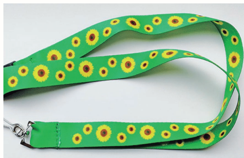
Colar de Girassol - ilustração da internet

Nem todas as deficiências são aparentes, mas para agilizar a identificação e o atendimento de pessoas com deficiências ocultas, como autismo, doenças de Crohn e outros transtornos, foi aprovada pela Câmara de Vereadores de Sumaré a lei que regulamenta no município o uso do Colar de Girassol.