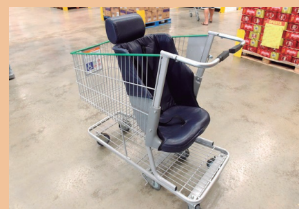
Carrinho de compra adaptado - ilustração da internet

A “Lei Nychollas”, que obriga supermercados e similares de Sumaré a destinarem 5% da totalidade dos carrinhos de compra adaptados a pessoas com deficiência, é outra importante iniciativa de inclusão social.